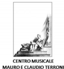
CENTRO MUSICALE MAURO E CLAUDIO TERRONI

Per informazioni sul concerto rivolgersi al Centro Musicale Mauro e Claudio Terroni, Segreteria dell'Orchestra, tel. 335-7716267